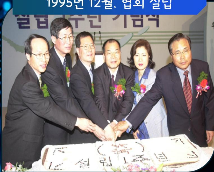
1995년 12월, 협회 설립